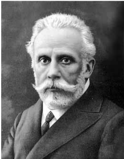
Pablo Iglesias, fundador del socialisme espanyol

La voluntat d'evocació de l'autor és remarcable i fa que les planes dedicades al pas per l'orfenat, les referències als sinistres empresaris o les línies que ens apropen a la davalla-